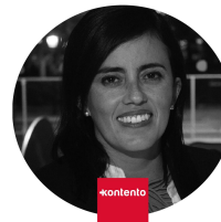
Documento realizado por: Ana Maria Restrepo Bustamante

Durante la Asamblea ordinaria de socios realizada el 15 de marzo de 2023 se dio aprobación al presente informe de Gestión BIC.